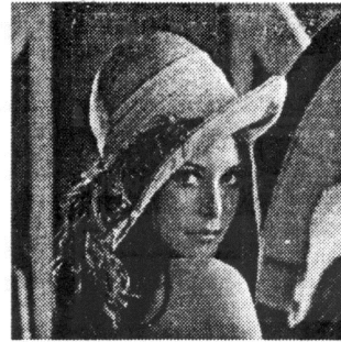
Figura 1: Imagem Lena

Para o desenvolvimento dos testes comparativos, têm-se adotado o procedimento mais comum existente na literatura da área, que é a geração de imagens com ruído a partir de imagens já existentes, para se ter a possibilidade de fazer uma comparação entre uma imagem com ruído depois da filtragem com a imagem ideal , que seria a própria imagem original, ou seja, antes da aplicação do ruído. Desta forma,