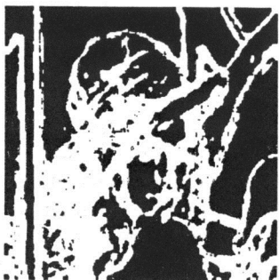
Figura 3: Regiões de alta atividade

dir o poder de suavização e medidas de erro, como relação sinal/ruído e erro médio quadrático para verificar a distorção das bordas. Estas medidas de erro são sempre calculadas em relação a alguma outra imagem, que no caso é a imagem dita original. O desvio padrão ou outra medida de homogeneidade pode ser calculado apenas nas imagens com ruído após a filtragem, mas implica na existência de uma área na imagem original que já apresentasse altos índices de homogeneidade, para que seja possível medir apenas o poder de eliminação de elementos ruidosos, sem interferência de possíveis bordas ou texturas.